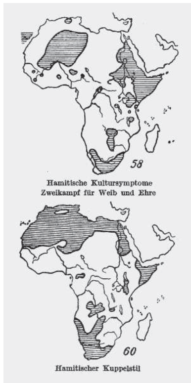
Abbildung: aus Frobenius' »Schicksalskunde«

Die Implikationen der kulturmorphologischen und nationalsozialistischen Körpermetaphorik sind schwerwiegend. Ein Organismus wie der menschliche Körper wird durch eine äußere Hülle begrenzt, die nicht beschädigt werden sollte. Ein solcher Körper